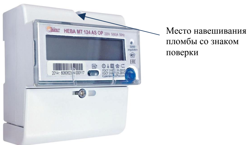
Рисунок 1 - Внешний вид модификации НЕВА МТ124 с местом опломбирования и нанесения знака поверки

Внешний вид счетчиков и места опломбирования с местом нанесения знака поверки представлены на рисунках 1 - 5.