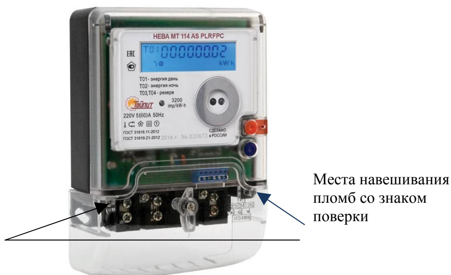
Рисунок 2 - Внешний вид модификации НЕВА МТ114 и (НЕВА МТ113) с местами опломбирования и нанесения знака поверки