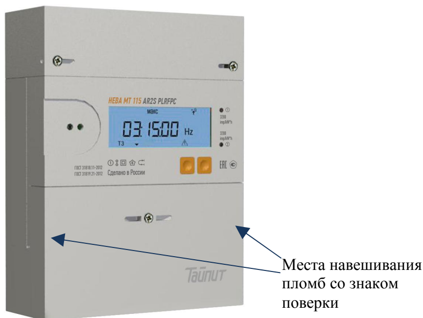
Рисунок 5 - Внешний вид модификации HEBA MT115 с местом опломбирования и нанесения знака поверки