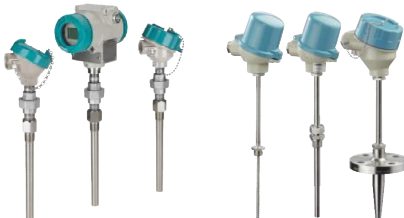
Рис.1 SITRANS TS500

Фотографии общего вида ТС приведены на рисунках 1-5.