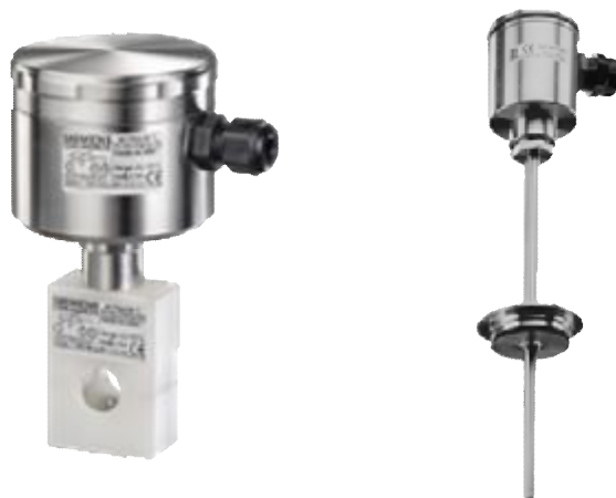
Рис.2 SITRANS TS300