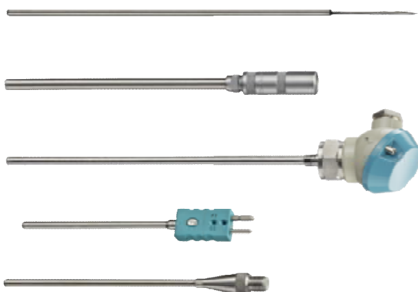
Рис.3 SITRANS TS200