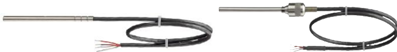
Рис.4 SITRANS TS100