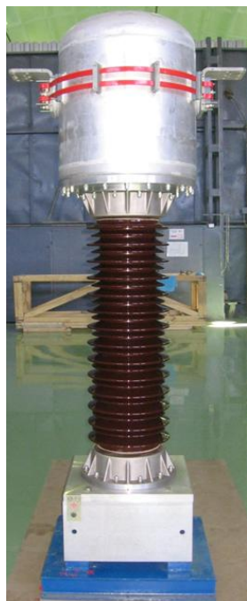
Рисунок 1 - Общий вид трансформатора тока ТОГФ (II)-110