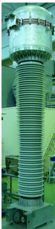
Рисунок 3 - Общий вид трансформатора тока ТОГФ (II)-330