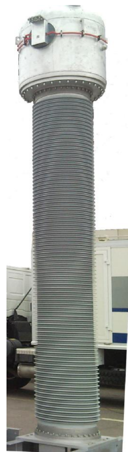
Рисунок 4 - Общий вид трансформатора тока ТОГФ (II)-500