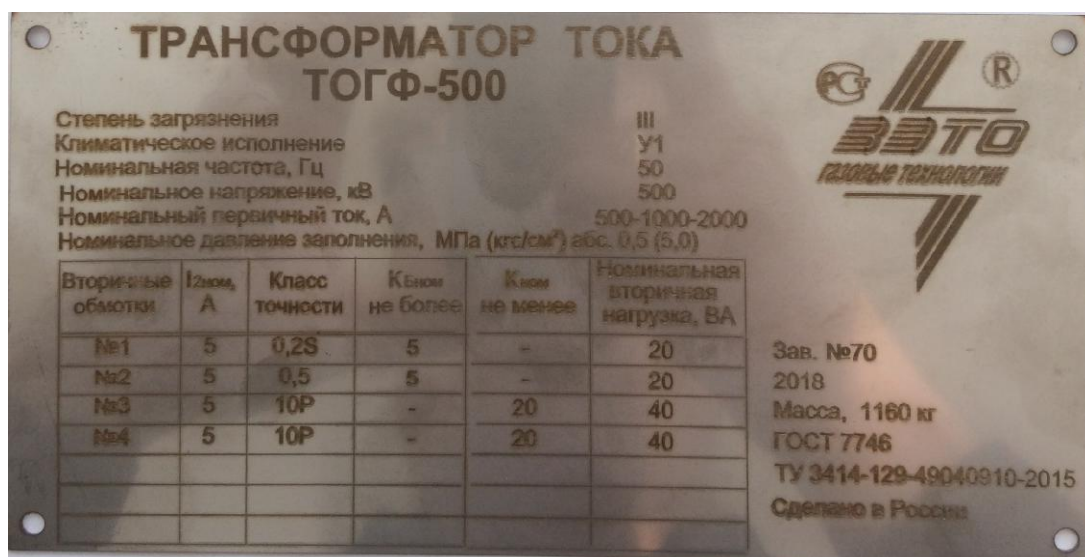
Рисунок 6 - Таблички технических данных трансформаторов