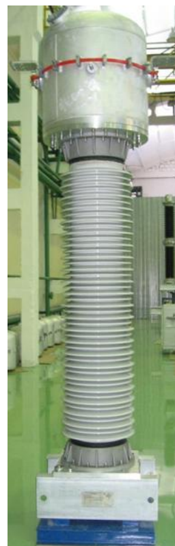
Рисунок 2 - Общий вид трансформатора тока ТОГФ (II)-220