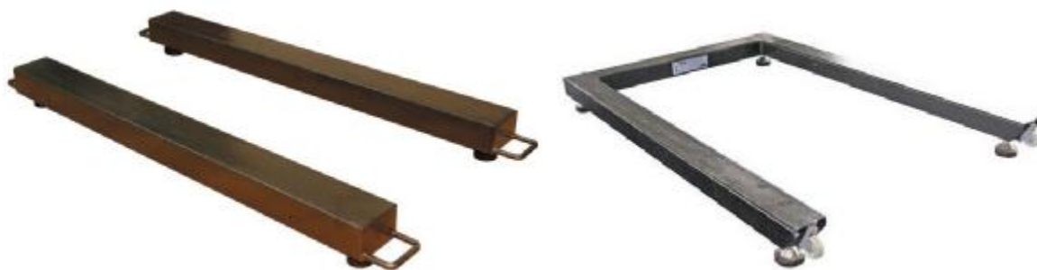
Ст – стержневые