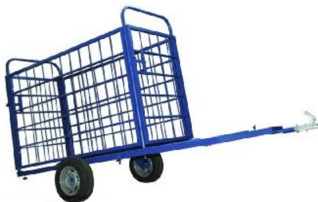
СкА – автоприцеп для взвешивания животных