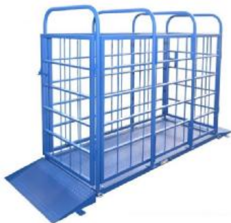
Ск – для взвешивания животных