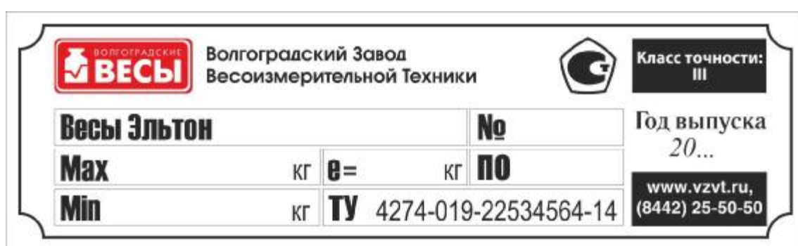
Рисунок 4 - Маркировка весов платформенных Эльтон

Маркировка весов производится на металлическом шильде, закрепленном на боковой поверхности грузоприемного устройства, на которой нанесено: