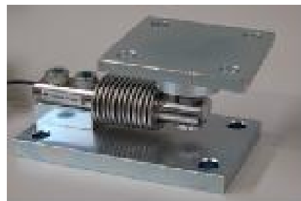
Рисунок 5 - Вид датчика семейства 355 с узлами встройки