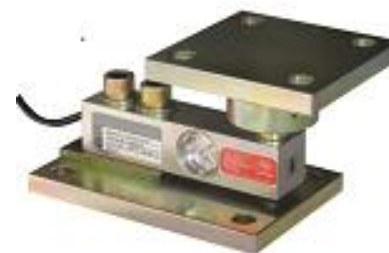
Рисунок 3 - Вид датчика семейства 65083 с узлами встройки