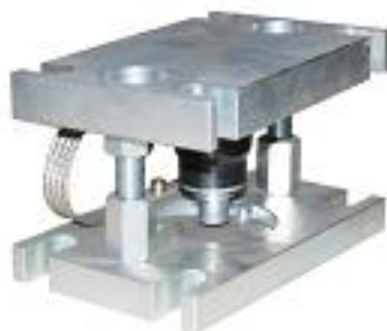
Рисунок 1 – Вид датчика семейства 220 с узлами встройки

Датчики весоизмерительные тензорезисторные Compression.