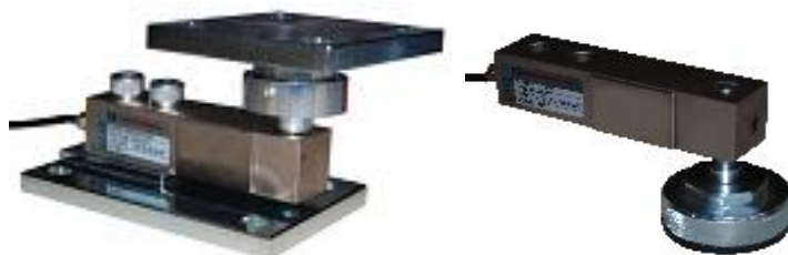
Рисунок 2 – Вид датчиков семейства 65023 с узлами встройки

Датчики весоизмерительные тензорезисторные Shear Beam