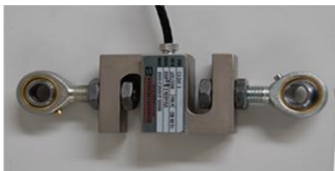
Рисунок 6 - Вид датчика семейства STC с узлами встройки