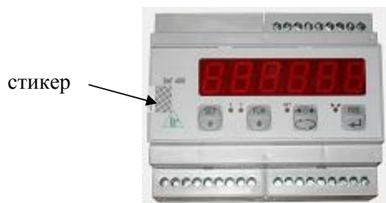
Рисунок 9 – Вид терминала DAT 400 с указанием места пломбировки