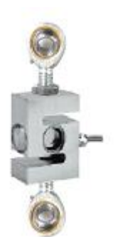
Рисунок 7 - Вид датчика семейства 620 с узлами встройки

Места пломбировки терминалов, исключая несанкционированные настройки и вмешательства, которые могут привести к искажению результатов измерений устройств (весов) показаны на рисунках 8 - 10, а процедура пломбировки описана в руководстве по эксплуатации на устройства.