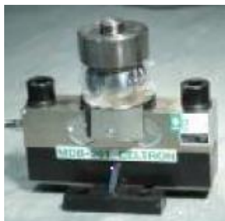
Рисунок 4 - Вид датчика семейства MDB с узлами встройки