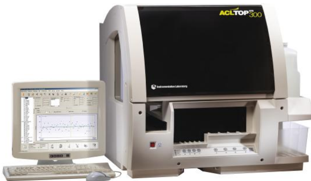
Рисунок 1 – Общий вид Анализатора коагулометрического автоматического ACL TOP 300 CTS