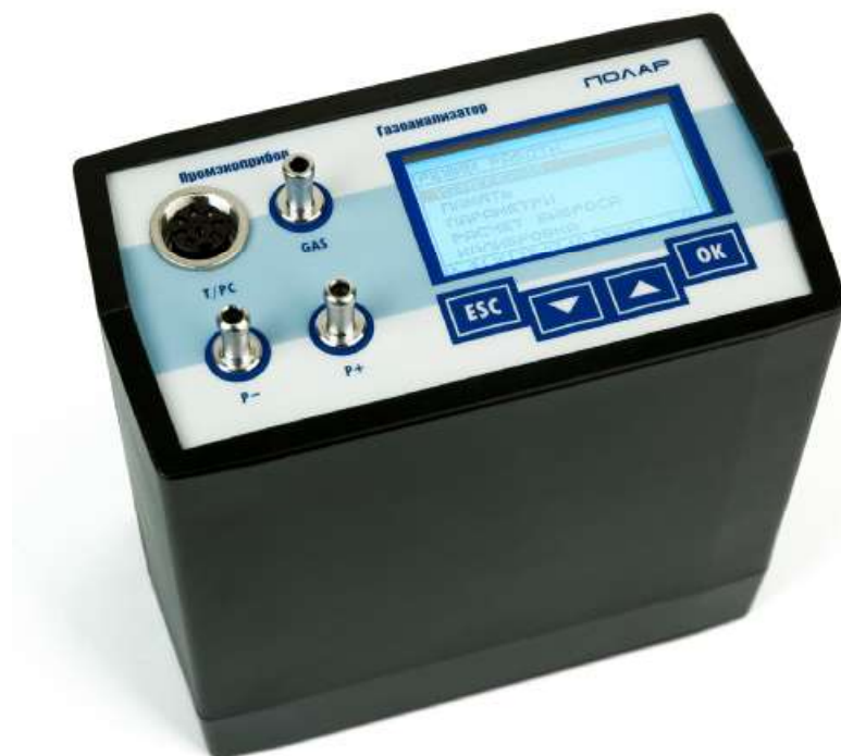
Рисунок 1 – Внешний вид газоанализаторов