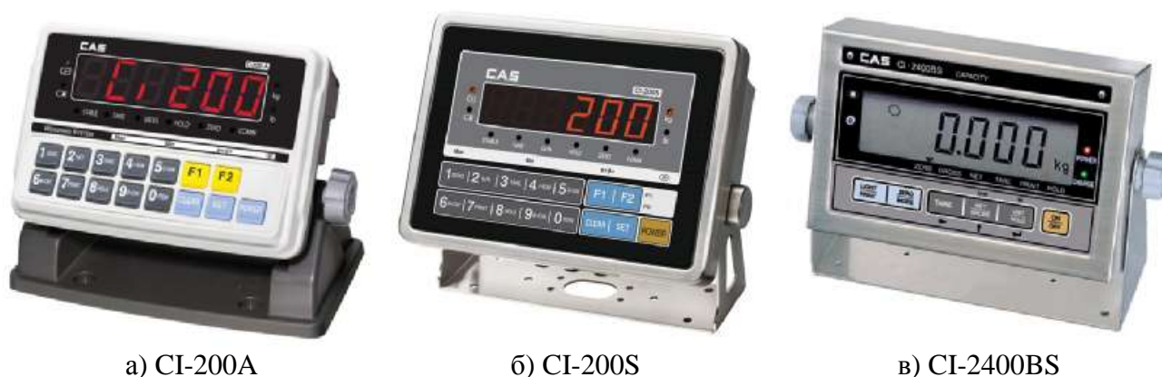
Рисунок 3 - Внешний вид приборов весоизмерительных