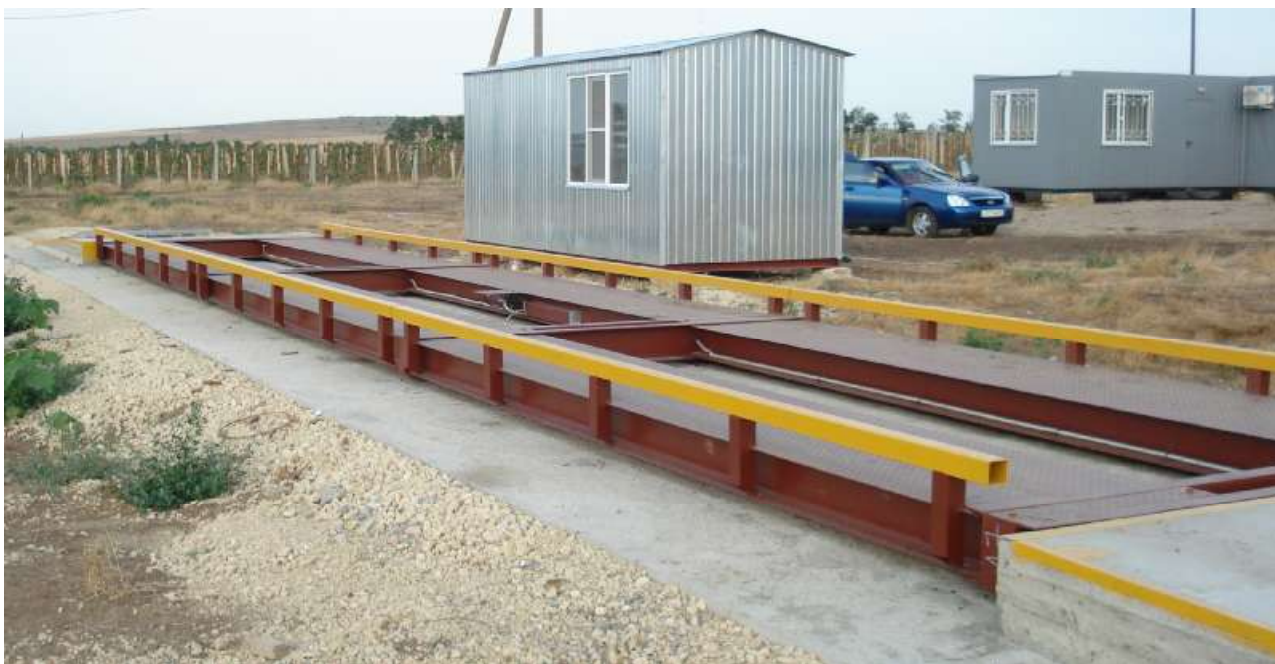
Рисунок 1 - Внешний вид весов Титан

Конструктивно весы состоят из грузоприемного устройства (ГПУ) и электронной части. В электронную часть входят приборы весоизмерительные одной из следующих моделей: CI-200A, CI-2400BS, CI-200S (Госреестр № 50968-12), «CAS Corporation», Республика Корея и ПЭВМ, если необходимо. Грузоприемное устройство включает в себя одну или несколько (до пяти) грузоприемных платформ (секций), установленных на датчики весоизмерительные тензорезисторные Column (модель HM14H1) (Zhonghang Electronic Measuring Instruments Co., LTD (ZEMIC), КНР, Госреестр № 55371-13), либо на датчики весоизмерительные тензорезисторные CCI («ASCELL SENSOR, S. L.», Испания, Госреестр № 51834-12), либо на датчики весоизмерительные тензорезисторные С (модель С16А) («Hottinger Baldwin Messtechnik GmbH», Германия, Госреестр № 60480-15).