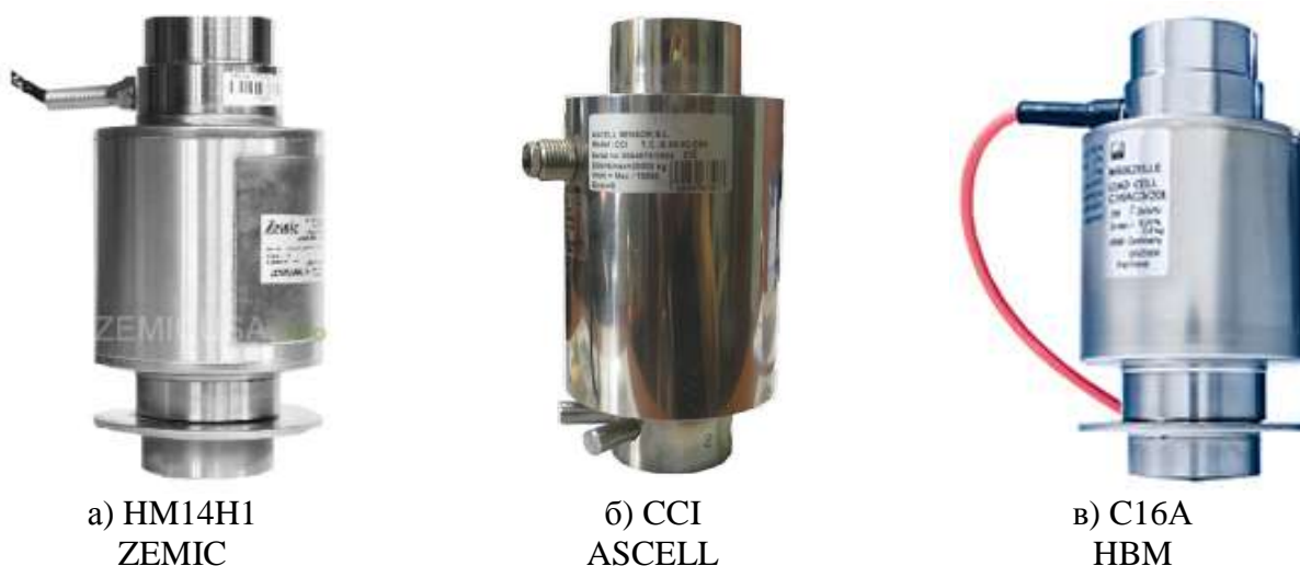
Рисунок 2 - Внешний вид датчиков тензорезисторных