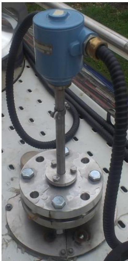
Рисунок 5. Уровнемер-плотномер ПМП-201