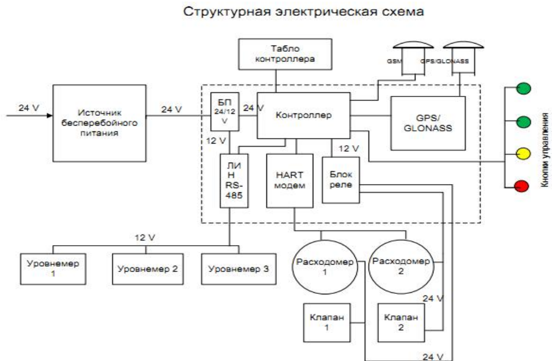
Рисунок 2 Структурная схема комплекса

Структурная схема комплекса представлена на рисунке - 2