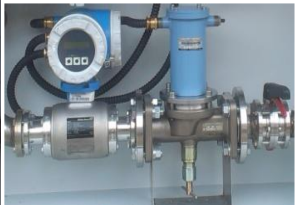
Рисунок 4. Блок слива