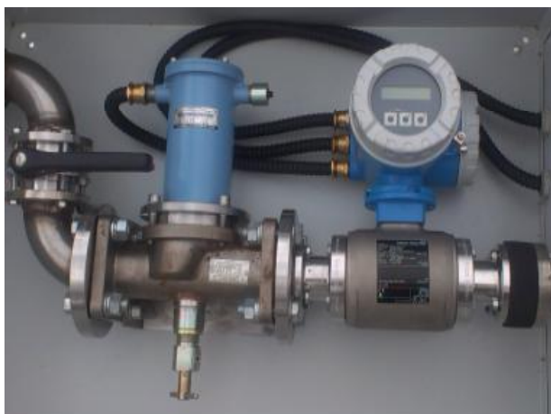
Рисунок 3. Блок налива