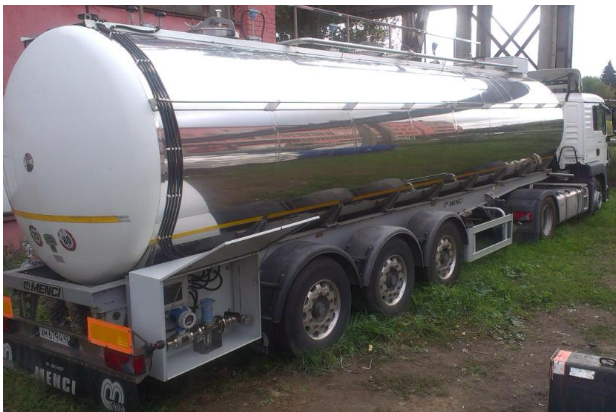
Рисунок 1. Общий вид автоцистерны с измерительным комплексом автоматизированного учета алкоголя "БАЗИС-Т"