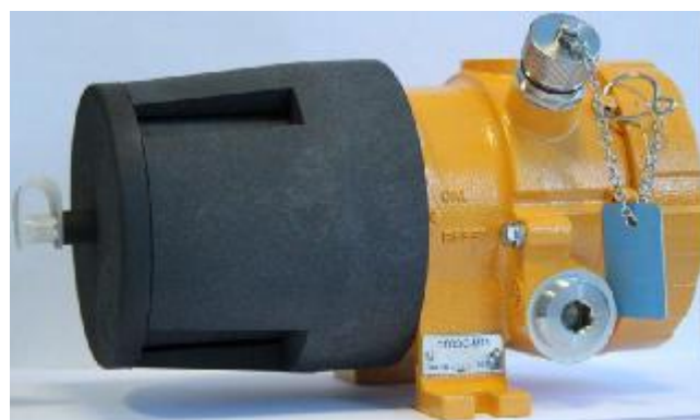
д) СГОЭС-М11 (исполнение в корпусе из алюминия)

Рисунок 3 - СГОЭС, СГОЭС-М, СГОЭС-М11 (СГОЭС-2, СГОЭС-М-2, СГОЭС-М11-2 имеют аналогичный внешний вид)