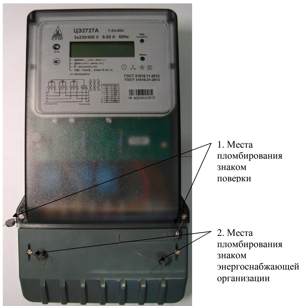
Рисунок 2 - Общий вид счетчика в корпусе B04 и места пломбирования