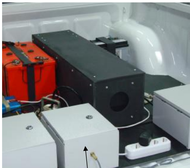
Рисунок 2 – Место нанесения оттиска поверительного клейма