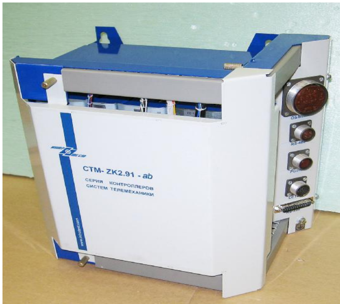
Рисунок 1. Внешний вид контроллера STM-ZK2.91

Пломбирование STM-ZK2.91 выполняется пломбированием винтов модулей ввода/вывода и процессора (модуля процессорного). Внешний вид конкретного варианта комплектации STM-ZK2.91 (STM-ZK2.91-01) и место нанесения пломбировки представлены на рисунках 1 и 2 соответственно.