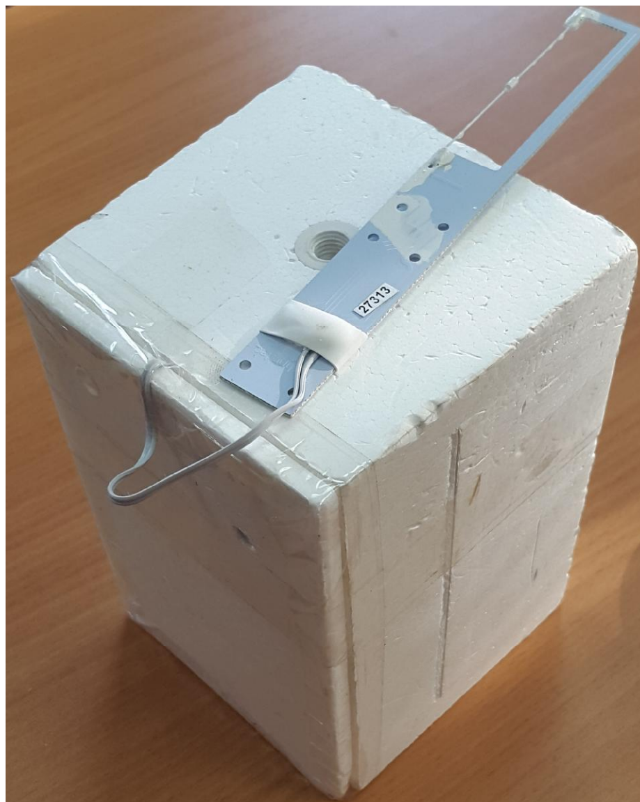
Рисунок 2 – Общий вид аэрологических радиозондов комплексного зондирования АК2-02м

Корпус радиозонда защищает электронные компоненты и батарею питания от механических повреждений и обеспечивает необходимый тепловой режим во время работы (полета).