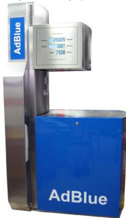
Рисунок 1 – Общий вид установок

Общий вид установок представлен на рисунке 1.