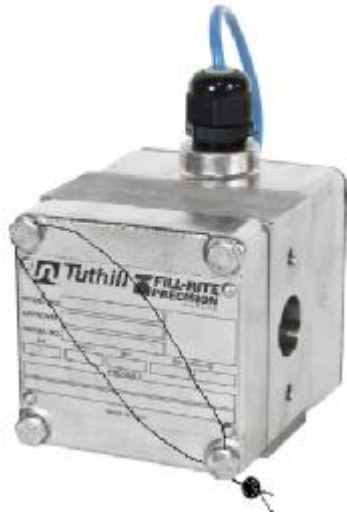
Рисунок 2 - Измеритель объема Tuthill TS06C

В установках предусмотрено опломбирование измерителя объема и защитной крышки переключателя «Настройка» электронно-вычислительного устройства ТОПАЗ-106-К2-2МР ЭМС ЖКД.