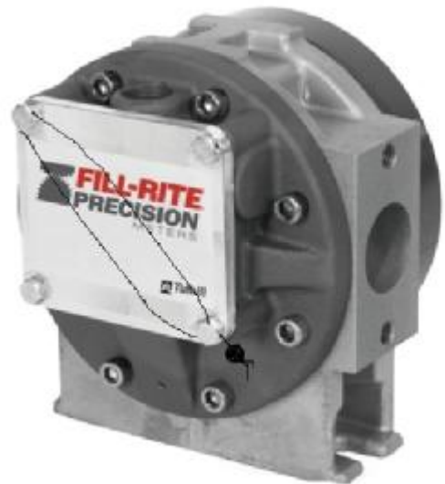
Рисунок 3 - Измеритель объема Tuthill TS10C

Измеритель объема FUQB4B-NW-040EA с датчиком импульсов заключен в неразборный корпус, механически защищен и пломбированию не подлежит.