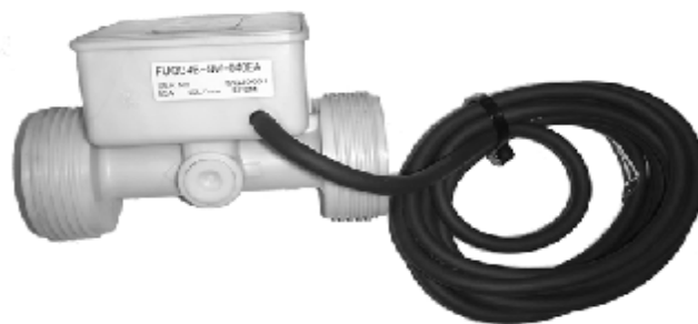
Рисунок 4 - Измеритель объема FUQB4B-NW-040EA

Измеритель объема FUQB4B-NW-040EA с датчиком импульсов заключен в неразборный корпус, механически защищен и пломбированию не подлежит.