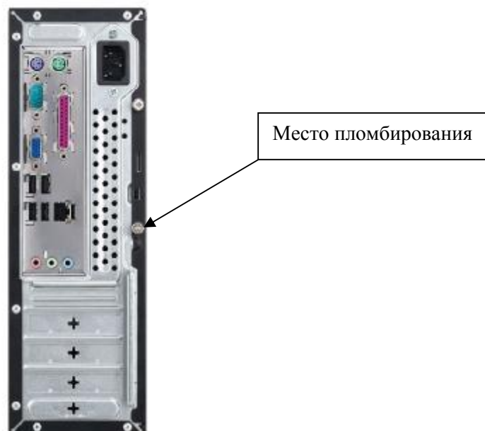
Рисунок 2 - Схема пломбировки электронного блока от несанкционированного доступа