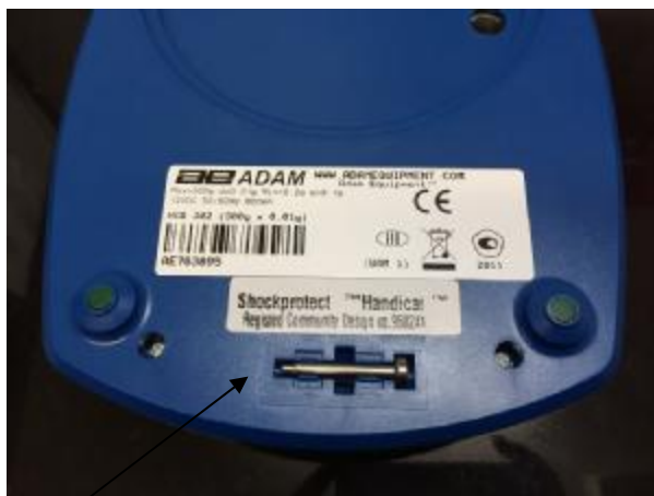
Рисунок 2 – Место нанесения свинцовой пломбы