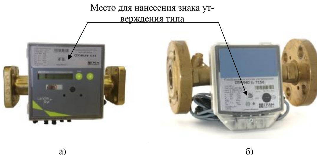
Рисунок 1 – Внешний вид преобразователей расхода ультразвуковых «СТРУМЕНЬ» Т150, а) исполнение с дисплеем; б) исполнение без дисплея

Внешний вид преобразователей расхода приведен на рисунке 1. Место для нанесения знака утверждения типа Российской Федерации показано на рисунке 1. Места клеймения и пломбирования приведены на рисунке 2.