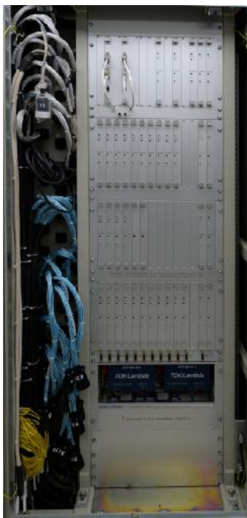
Рисунок 2 - Внешний вид информационно-измерительного устройства УИ-174Р16

Внешний вид информационно-измерительного устройства УИ-174Р16 представлен на рисунке 2.