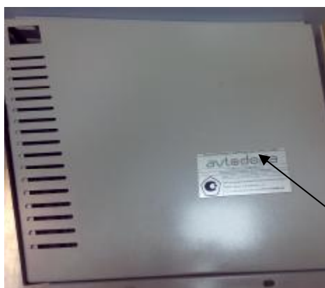
место нанесения знака утверждения типа