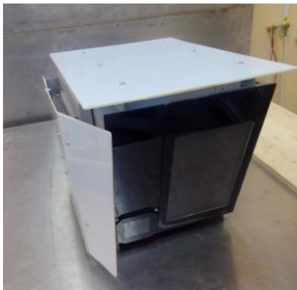
Рисунок 1 – Внешний вид регистраторов