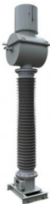
Рисунок 4 – Общий вид трансформаторов тока ТГМ-220