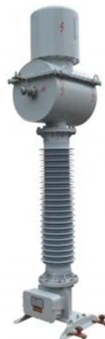
Рисунок 3 – Общий вид трансформаторов тока ТГМ-110