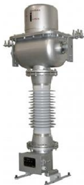
Рисунок 2 – Общий вид трансформаторов тока ТГМ-35

Рабочее положение трансформаторов в пространстве – вертикальное.