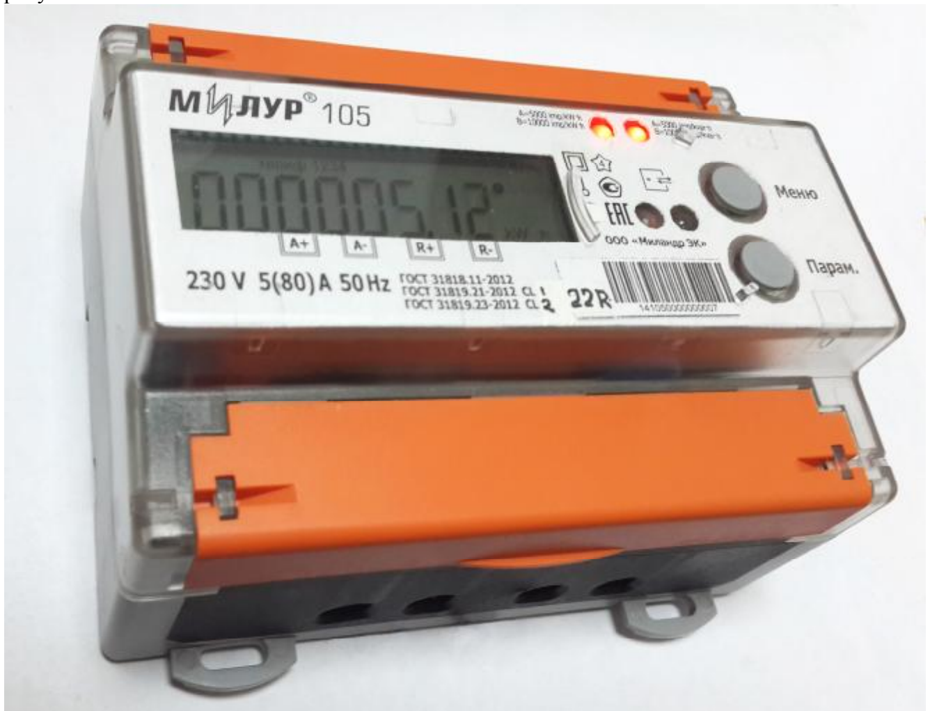
Рисунок 1 – Внешний вид счетчика

Внешний вид счетчика «Милур 105» с закрытыми клеммными крышками приведён на рисунке 1.