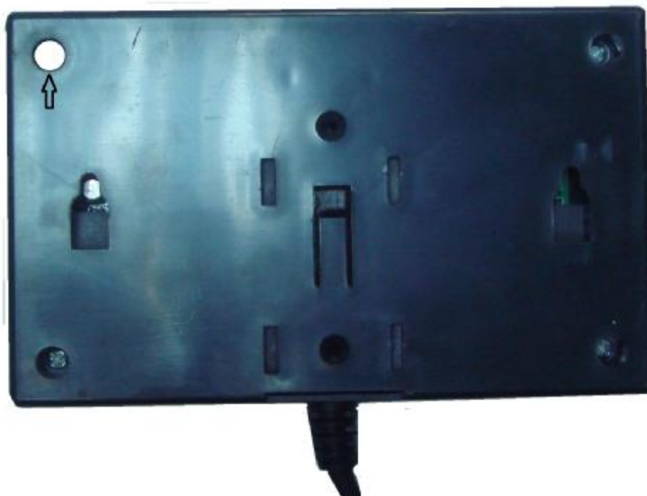
Рисунок 3 Схема пломбировки от несанкционированного доступа и обозначение места для нанесения отиска клейма.

После поверки весы пломбируются поверителем пломбой, закрывающей доступ внутрь корпуса весов (рисунок 3).