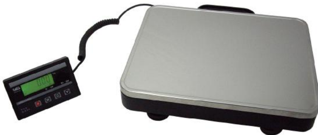
Рисунок 1 Внешний вид весов платформенных ВС

М – максимальная нагрузка, указанная в килограммах.