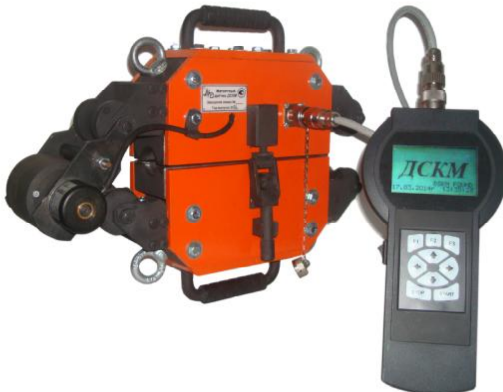
Рисунок 1. Внешний вид ДСКМ-МД5.

Внешний вид дефектоскопов стальных канатов магнитных ДСКМ-МД5 представлен на рисунке 1.