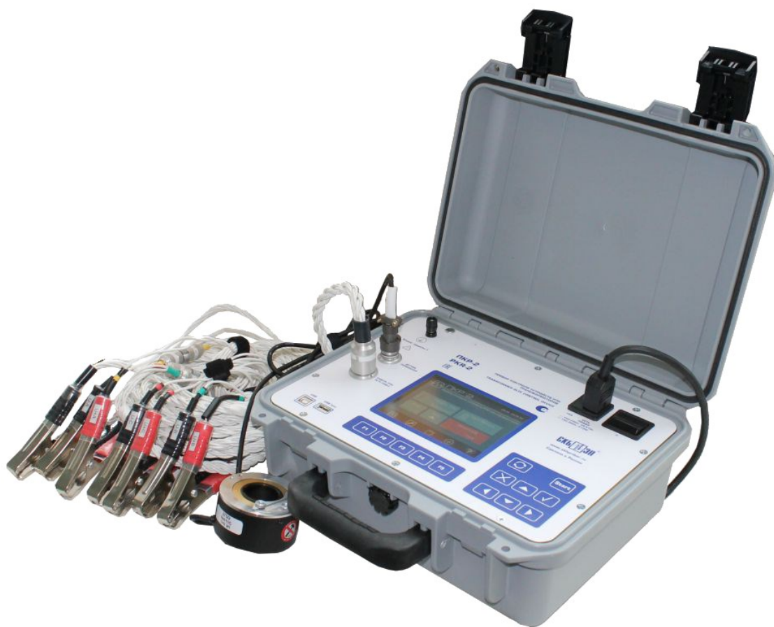
Рис. 2 Измерительный блок