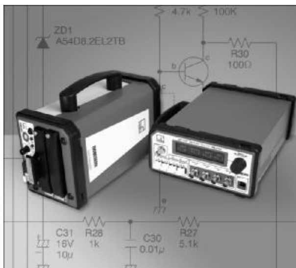
Рисунок 6: Фото общего вида систем измерительных с оптической изоляцией ISOBE5600