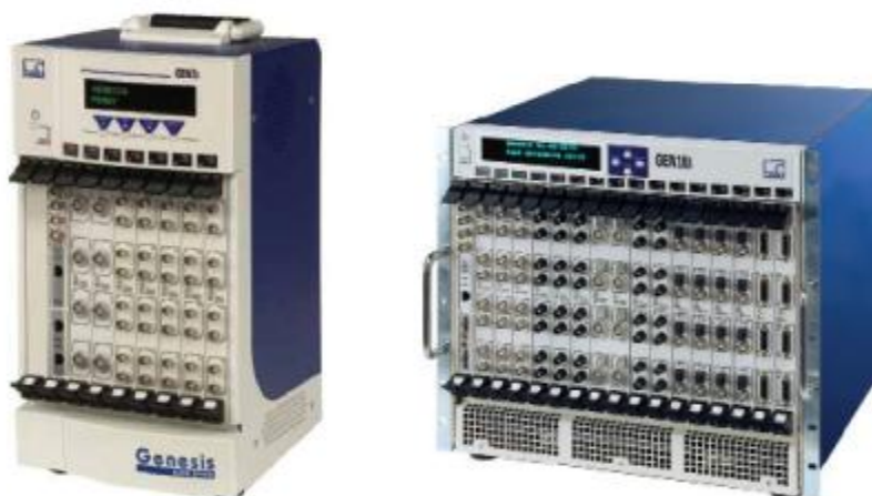
Рисунок 4 Фото общего вида многоканальных модульных устройств сбора данных GEN7t, GEN16t

Метрологические и основные технические характеристики портативных модульных регистраторов данных со встроенным ПК GEN2i, GEN3i, GEN5i, GEN7i и многоканальных модульных устройств сбора данных GEN3t, GEN7t, GEN16t приведены в таблицах 3-10 и определяются используемыми в их составе сменными модулями серии GEN DAQ.