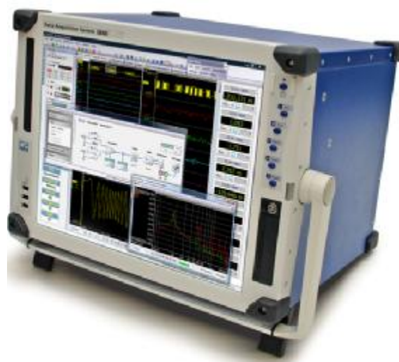
Рисунок 2 Фото общего вида портативных модульных регистраторов данных со встроенным ПК GEN5i, GEN7i

Многоканальные модульные устройства сбора данных GEN3t и GEN7t выполнены в корпусе настольного исполнения, GEN16t - для установки в приборную стойку; для устройств имеется возможность установки твердотельного жёсткого диска; они оснащены интерфейсом аппаратной синхронизации между модулями Master/Slave; для них возможно использование интерфейса синхронизации по времени IRIG или IRIG/GPS.