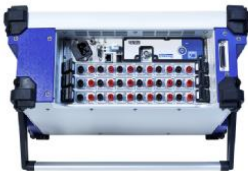
Рисунок 3 Фото общего вида многоканальных модульных устройств сбора данных GEN3t