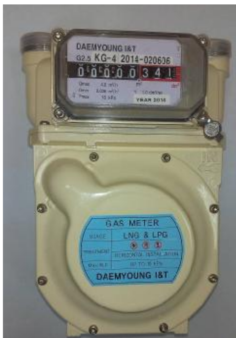
Фото 1. Общий вид счетчика газа KG-4

В зависимости от расположения входного штуцера счетчики имеют два исполнения (левое и правое).