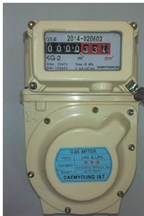
Фото 2. Общий вид счетчика газа KG-2