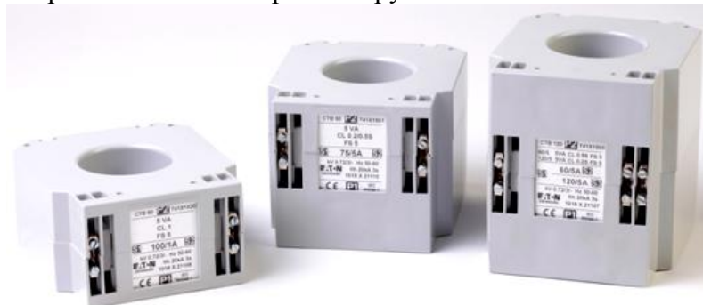
Рисунок 1. Трансформаторы тока СТВ

Трансформаторы относятся к не ремонтируемым и не восстанавливаемым изделиям.