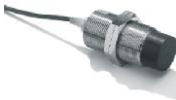
Рисунок 4 - Внешний вид датчика E2A

Контрольно-измерительный блок (собственно измеритель вибрации многоканальный) STD-2060 производства ООО «ТД «Технекон» является многоканальным виброизмерительным прибором, осуществляющим сбор и цифровую обработку сигналов, вычисление параметров вибрации и частот вращения, контроль уставок с замыканием выходных реле предупредительной и аварийной сигнализации и передачу вычисленных параметров во внешние устройства по интерфейсу RS-485.