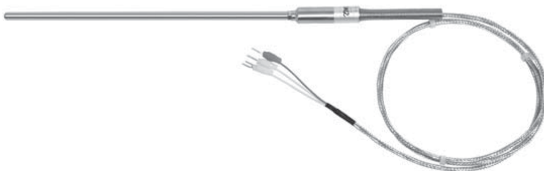
Рис.3 ТС модификаций R311, R312, R321, R322, R331, R332