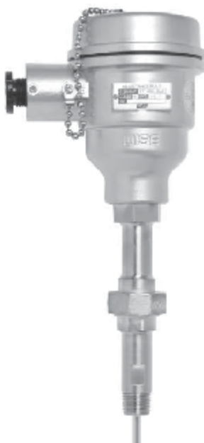
Рис.2 ТС модификаций R221, R222