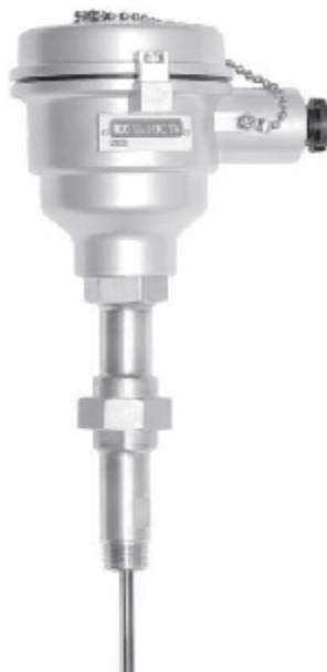
Рис.5 ТС модификаций R921, R922, R941, R942, R951, R952