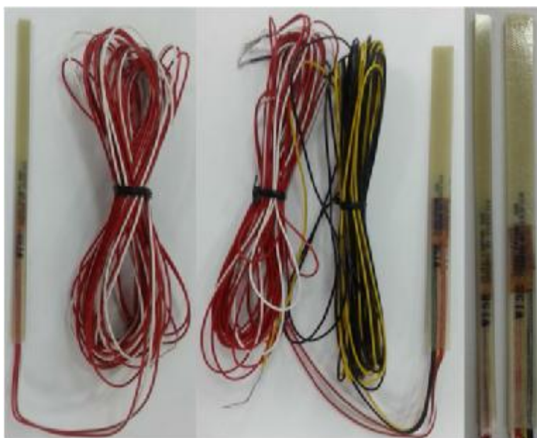
Рис.4 ТС модификаций R810, R820, R830