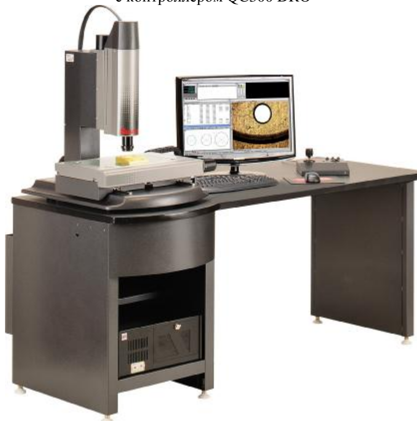
Рисунок 2 – Видеосистемы измерительные AV200/AV300, AVR 200/AVR300 с контроллером QC5000