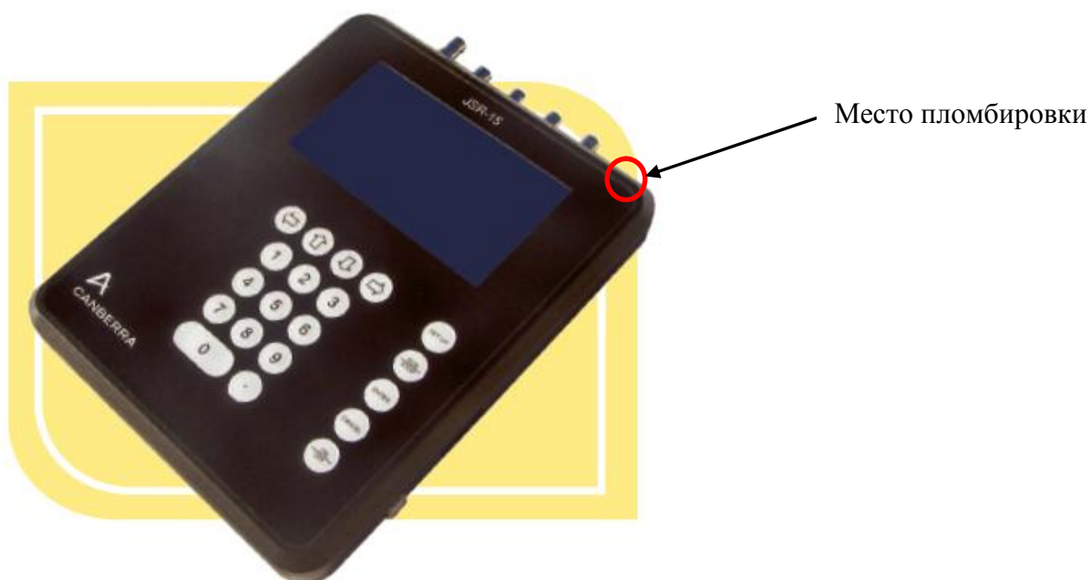
Рисунок 3 – Анализатор нейтронных совпадений JSR-15,общий вид.