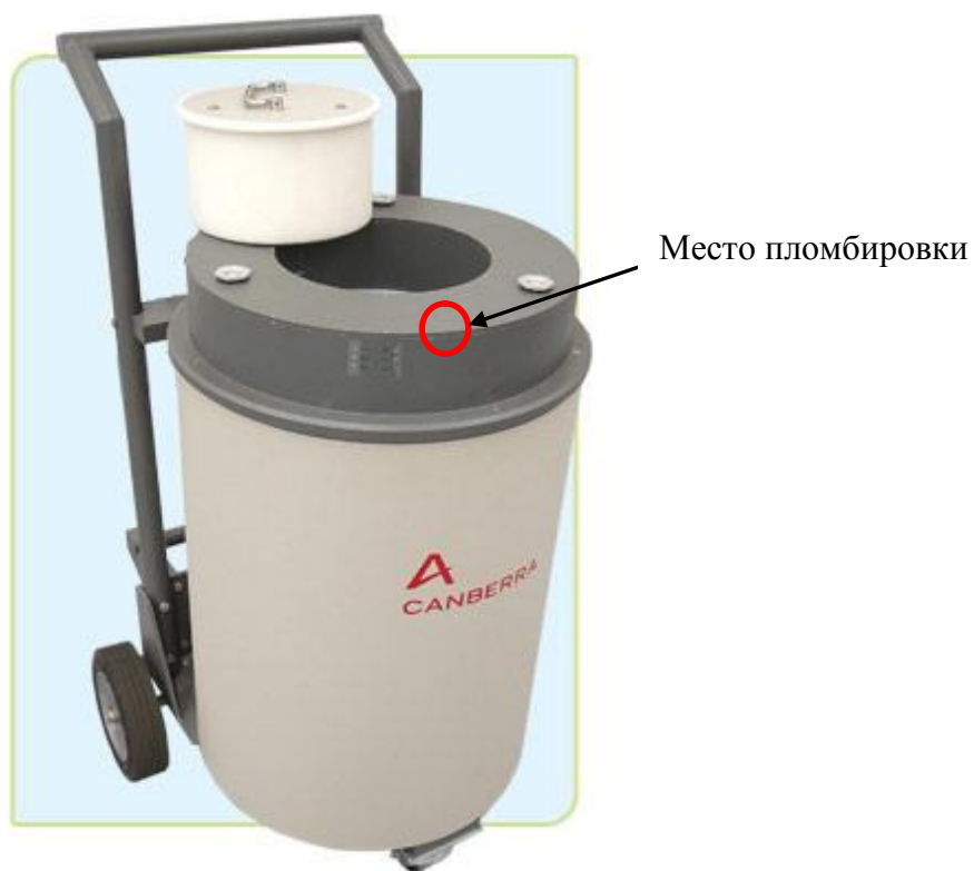
Рисунок 2 – Устройство детектирования JCS-51,общий вид.

Внешний вид компонентов счетчика АWCC и места пломбировки в целях защиты от несанкционированного доступа представлены на рисунках 2-3. Места пломбировки показаны стрелками.