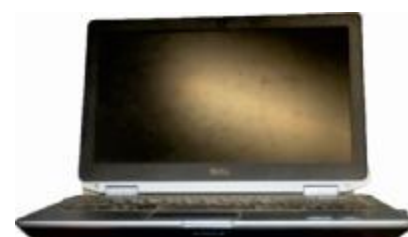
Компьютер типа ноутбук