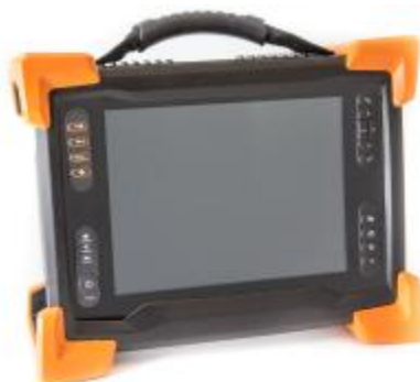
Электронный блок Reddy