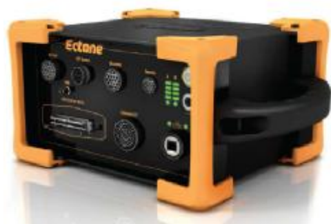
Электронный блок Ectane

Совместно с дефектоскопами применяются проходные ВТП для проведения внутритрубного контроля и накладные ВТП для обнаружения дефектов при контроле внешних поверхностей деталей.