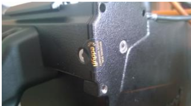
Рисунок 2 - Схема пломбировки от несанкционированного доступа

Дефектоскопы пломбируется на боковой стороне электронного блока. Схема пломбировки от несанкционированного доступа приведена на рисунке 2.