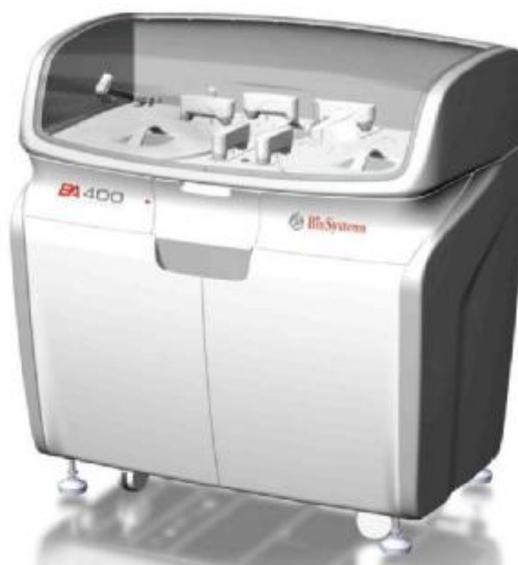
Рисунок 1 – Общий вид анализатора лабораторного автоматического биохимического ВА400