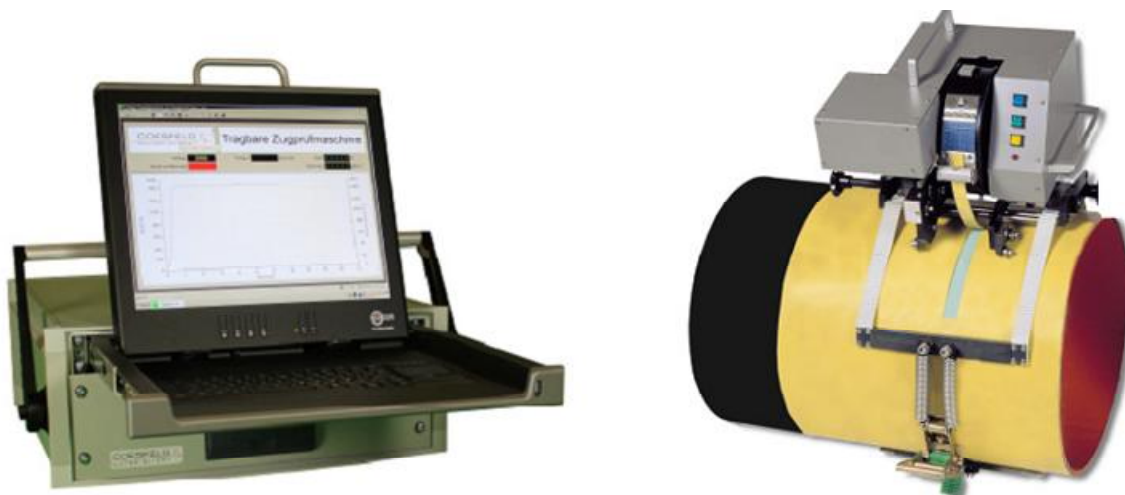
Рисунок 2 – Внешний вид: блока управления с выдвинутым дисплеем – слева; измерительного блока, закрепленного на трубе с полимерным покрытием – справа.

В блок управления встроен генератор звуковых сигналов, подаваемых при перегрузке, окончании измерений и срабатывании концевого выключателя.