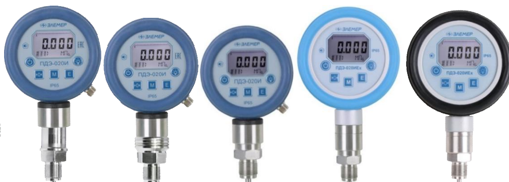
Рисунок 2 - Внешний вид преобразователей ПДЭ-020И