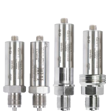
Рисунок 1 - Внешний вид преобразователей ПДЭ-020