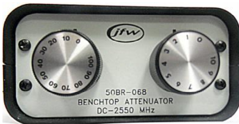
Рисунок 1 – Фотография общего вида аттенюаторов

Фотография общего вида аттенюаторов представлена на рисунке 1.