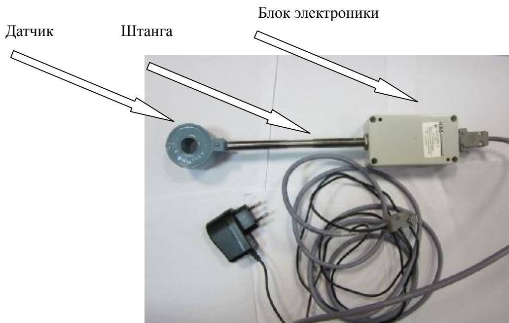
Рисунок 1 - Внешний вид составных частей ДЭИ

Общий вид составных частей и ДЭИ в сборе представлены на рисунках 1 и 2. Места пломбирования от несанкционированного доступа и размещения знака утверждения типа приведены на рисунке 2.