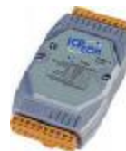
Модули аналогового вывода