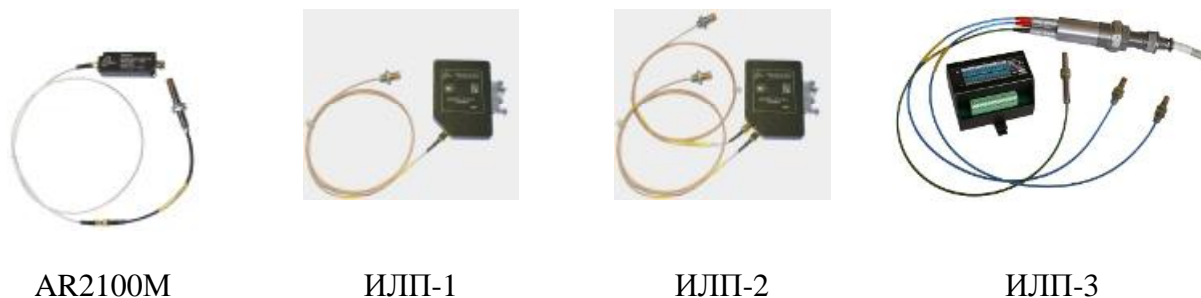
Рисунок 6 - Внешний вид вихретоковых датчиков AR2100M, измерителей линейных перемещений одноканальных ИЛП-1, двухканальных ИЛП-2 и трехканальных ИЛП-3

Каналы измерения частоты вращения представляют собой два типа измерительной цепи. Первый тип измерительной цепи состоит из согласующего устройства и измерительного прибора. Второй тип состоит из преобразователя, согласующего устройства и измерительного прибора. В качестве преобразователя используются вихретоковые датчики AR2100M, измерители линейных перемещений одноканальные ИЛП-1, измерители линейных перемещений двухканальные ИЛП-2, измерители линейных перемещений трехканальные ИЛП-3 производства ООО «ТД «Технекон», а также индуктивные датчики E2A производства «Omron», Япония. В качестве согласующего устройства с преобразователями AR2100M, ИЛП-1, ИЛП-2, ИЛП-3 используются модуль согласующий MC-04 или модуль согласующий MC-06 совместно с формирователем ФР-04. В качестве согласующего устройства с преобразователем E2A используется модуль согласующий MC-07. В качестве согласующего устройства при подключении к каналу внешнего сигнала от индуктивных датчиков используется формирователь ФР-04. В качестве измерительного прибора используются преобразователь виброизмерительный вторичный СТД-3168 с модулем аналогового вывода, преобразователь сигналов VCM или преобразователь вибрации VST из состава измерителя ИЛП-2.