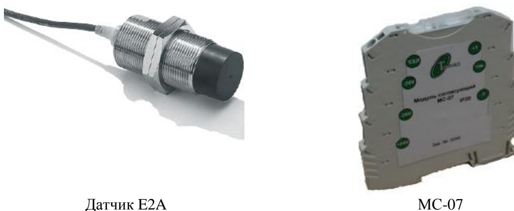
Рисунок 7 - Внешний вид индуктивного датчика E2A и модуля согласующего MC-07

Внешний вид индуктивных датчиков E2A и модуля согласующего MC-07 приведен на рисунке 7.