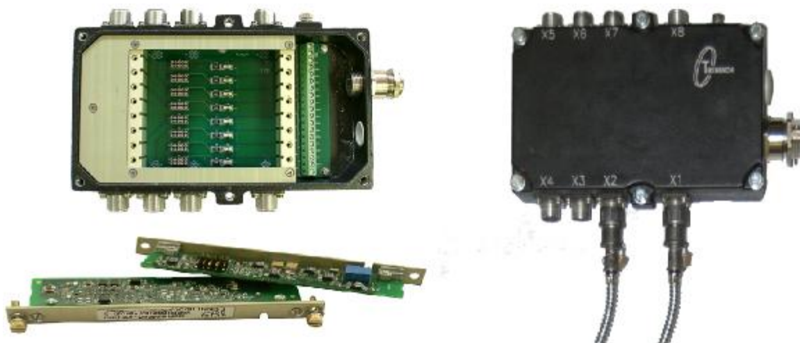
Рисунок 3 - Внешний вид усилителя заряда ПУ-06 и сменных модулей типа УС-091/091М/УС-093/УС-094

Внешний вид усилителя заряда ПУ-06 и сменных модулей типа УС-091/091М/УС-093/УС-094 приведен на рисунке 3. Внешний вид усилителей согласующих УС-092, МС-093 и МС-094 приведен на рисунке 4.