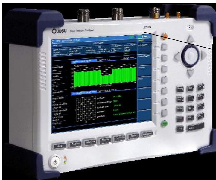
Рисунок 1 – Внешний вид анализаторов JD745A