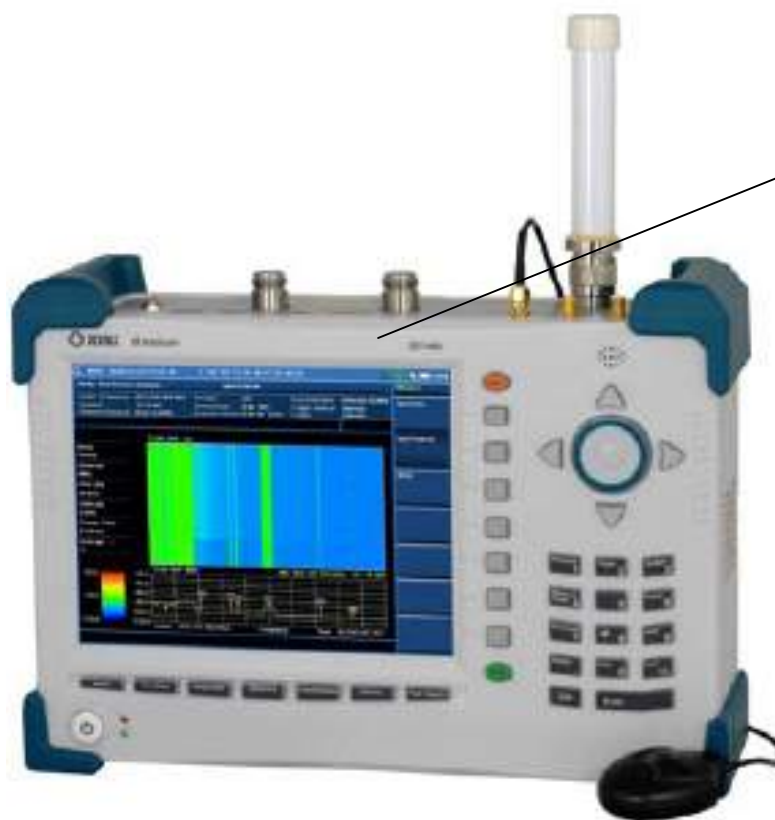
Рисунок 2 – Внешний вид анализаторов JD746A