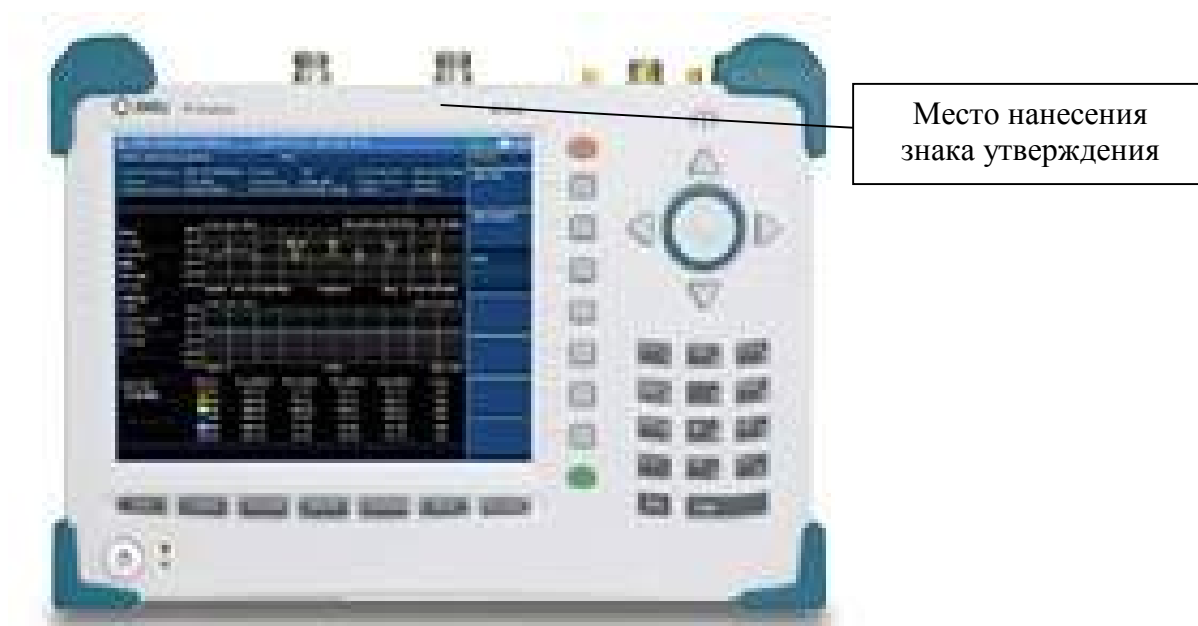
Рисунок 3 – Внешний вид анализаторов JD748A