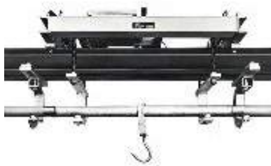
Рисунок 1 – Внешний вид ГПУ

Общий вид ГПУ показан на рисунке 1, а терминала - на рисунке 2.