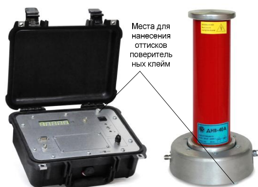
Рисунок 1 - Внешний вид киловольтметра СКВ-40-П

Фотографии общего вида представлены на рисунках 1 - 4.