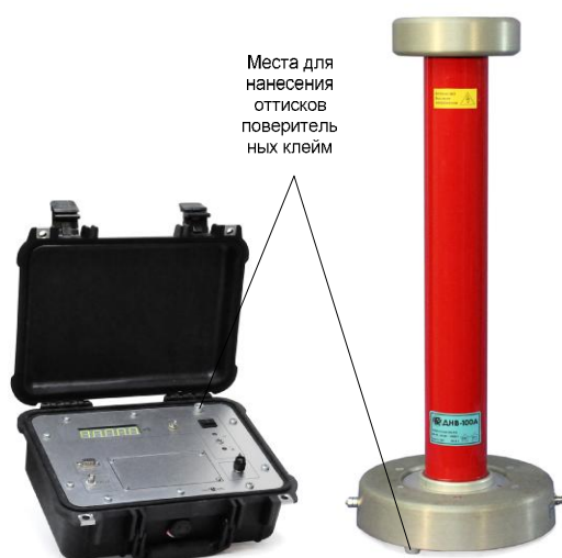
Рисунок 3 - Внешний вид киловольтметра СКВ-100-П