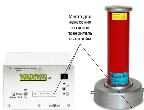
Рисунок 2 - Внешний вид киловольтметра СКВ-40-СТ