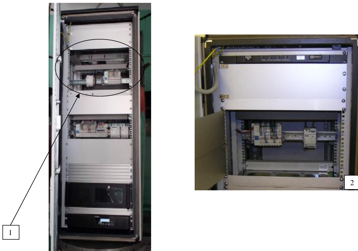
Рисунок 2 – УИ-ТЦ в стойке шкафа технических средств: вид сзади (1) и спереди (2)