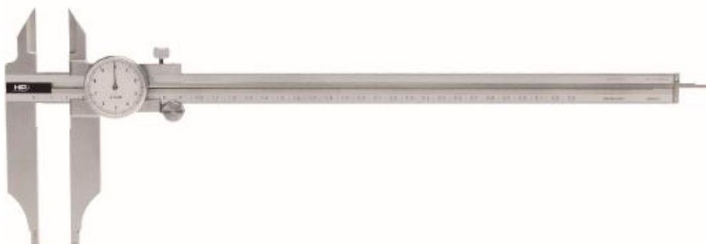
Рисунок 3 – Общий вид штангенциркулей модификации 0219