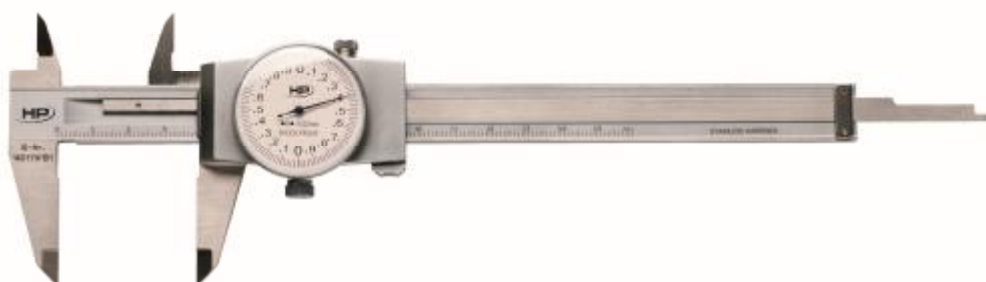
Рисунок 2 – Общий вид штангенциркулей модификаций 0217 и 0218