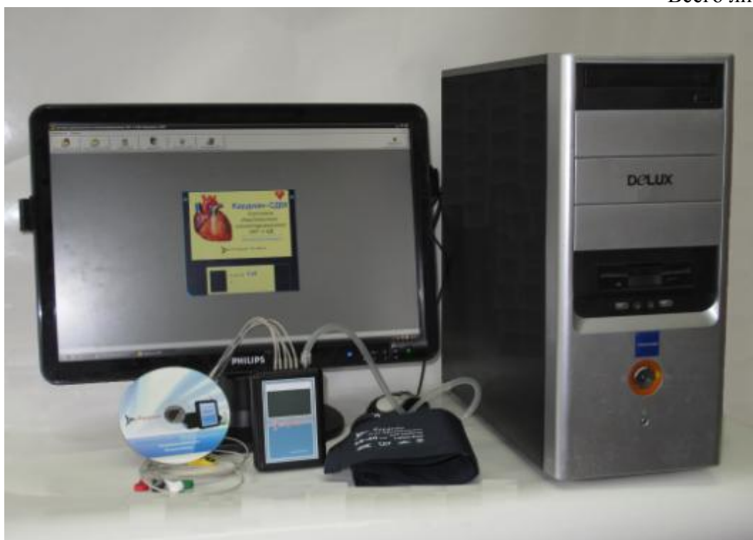
Рисунок 1 - Система длительного мониторинга электрокардиограмм и артериального давления "Кардиан-СДМ"

Схема маркировки и пломбировки представлена на Рисунке 2.