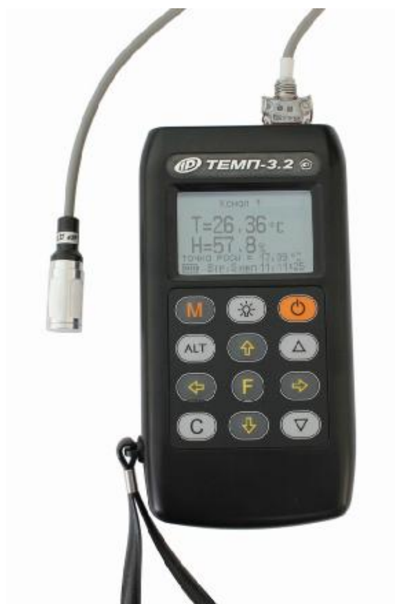
Рисунок 2 – Общий вид приборов модификации «ТЕМП-3.20» с совмещенным датчиком ДТГ