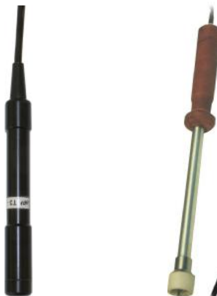
Рисунок 4 – Общий вид дополнительных датчиков температуры поверхности ТЗ-ПО оконный и температуры поверхности ТЗ-П