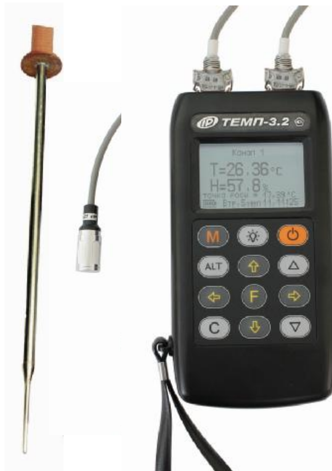
Рисунок 3 – Общий вид приборов модификации «ТЕМП-3.21», «ТЕМП-3.22» с совмещенным датчиком ДТГ и дополнительным датчиком температуры среды ТЗ-С погружным