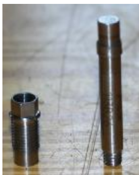
Рисунок 1 - Внешний вид датчика

Внешний вид датчиков с указанием места нанесения знака утверждения типа и места пломбирования приведены на рисунках 1,2.