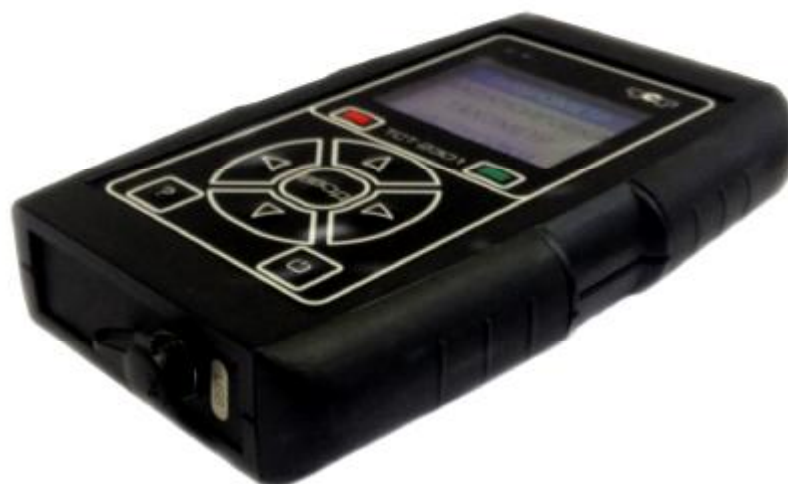
Рисунок 1. Внешний вид

Внешний вид ВБ приведен на рисунке 1. Место пломбирования голографической наклейкой ВБ от несанкционированного доступа приведено на рисунке 2.