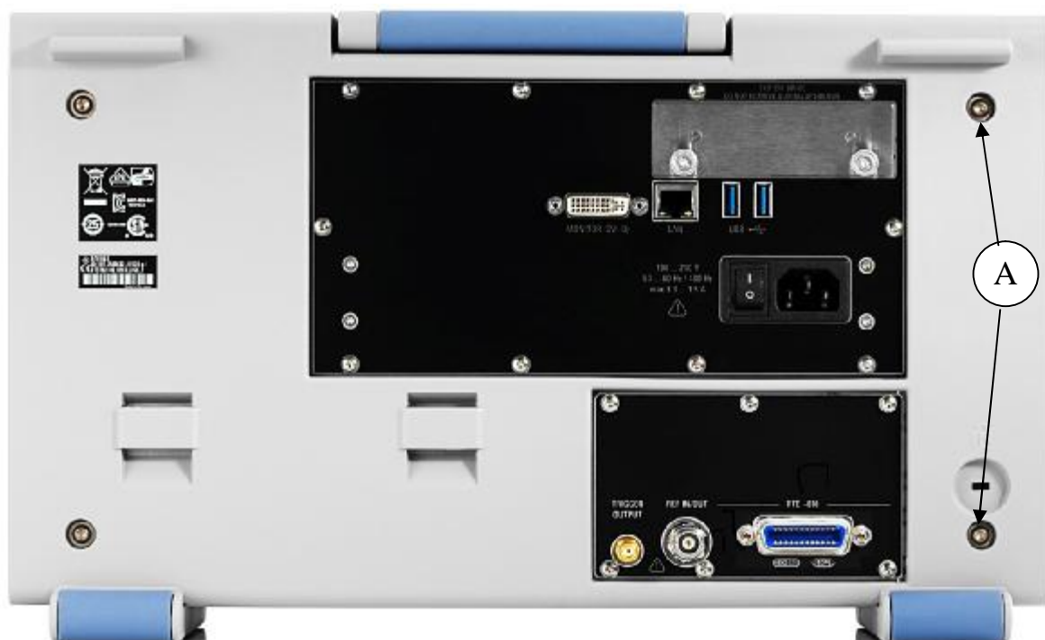
Рисунок 2 - Схема пломбировки от несанкционированного доступа (А)