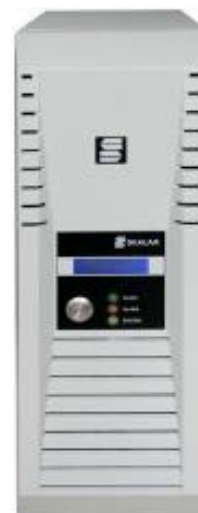
б) модуль питания и передачи данных