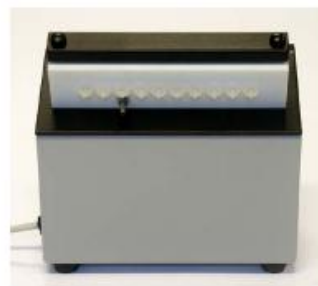
г) автоматический промывной клапан