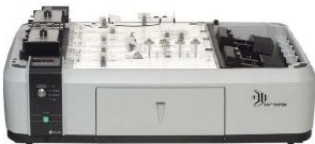
в) химический блок