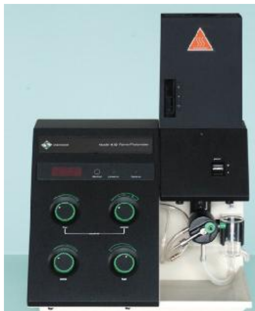
д) фотометр пламенный